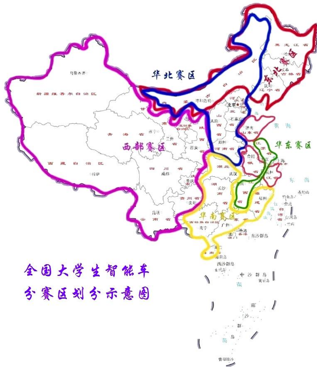
全国大学生智能车 分赛区划分示意图